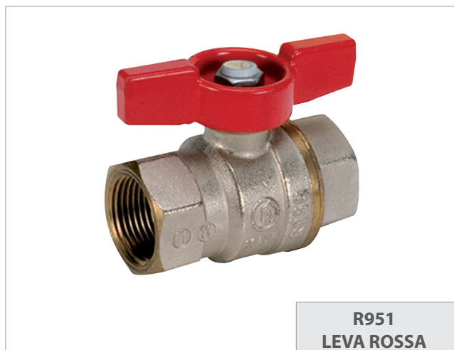
R951 LEVA ROSSA