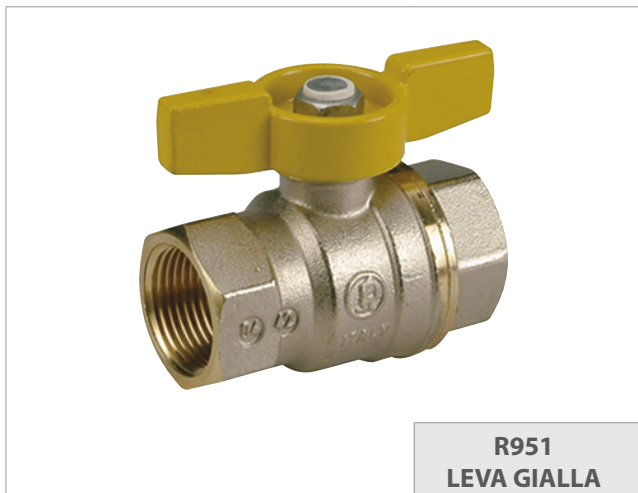
R951 LEVA GIALLA